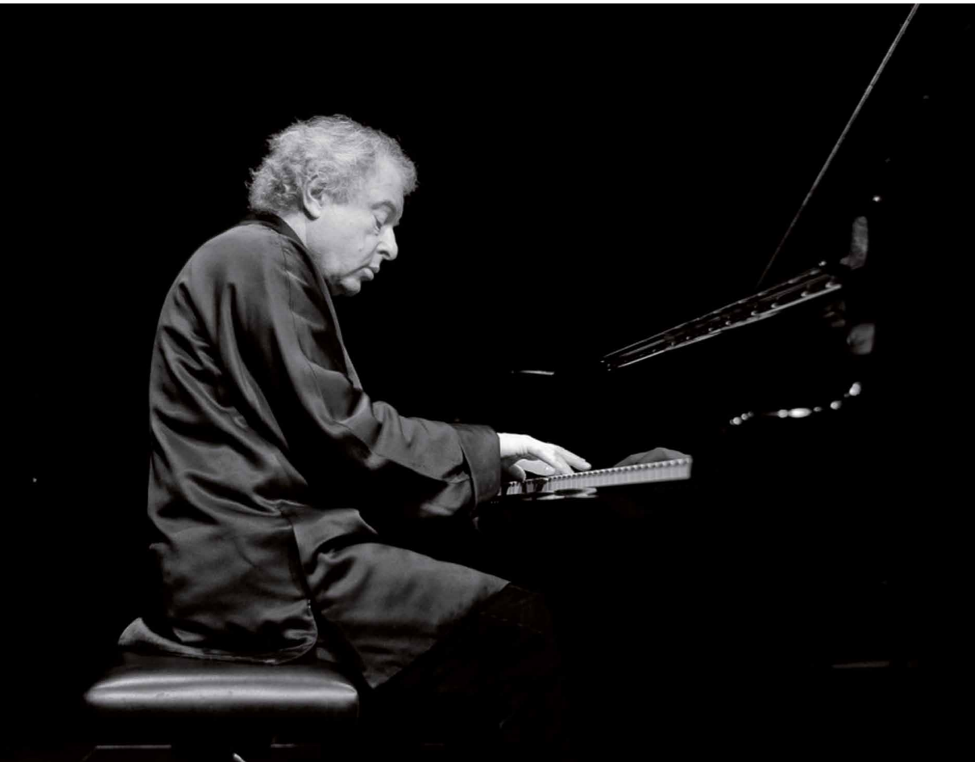
Sir Andrés Schiff

« Il m'est plus spontané d'annoncer le programme sur place et d'expliquer les œuvres. Cela crée une connexion avec le public ; nous sommes ensemble pour vivre quelque chose. » Sir Andrés Schiff