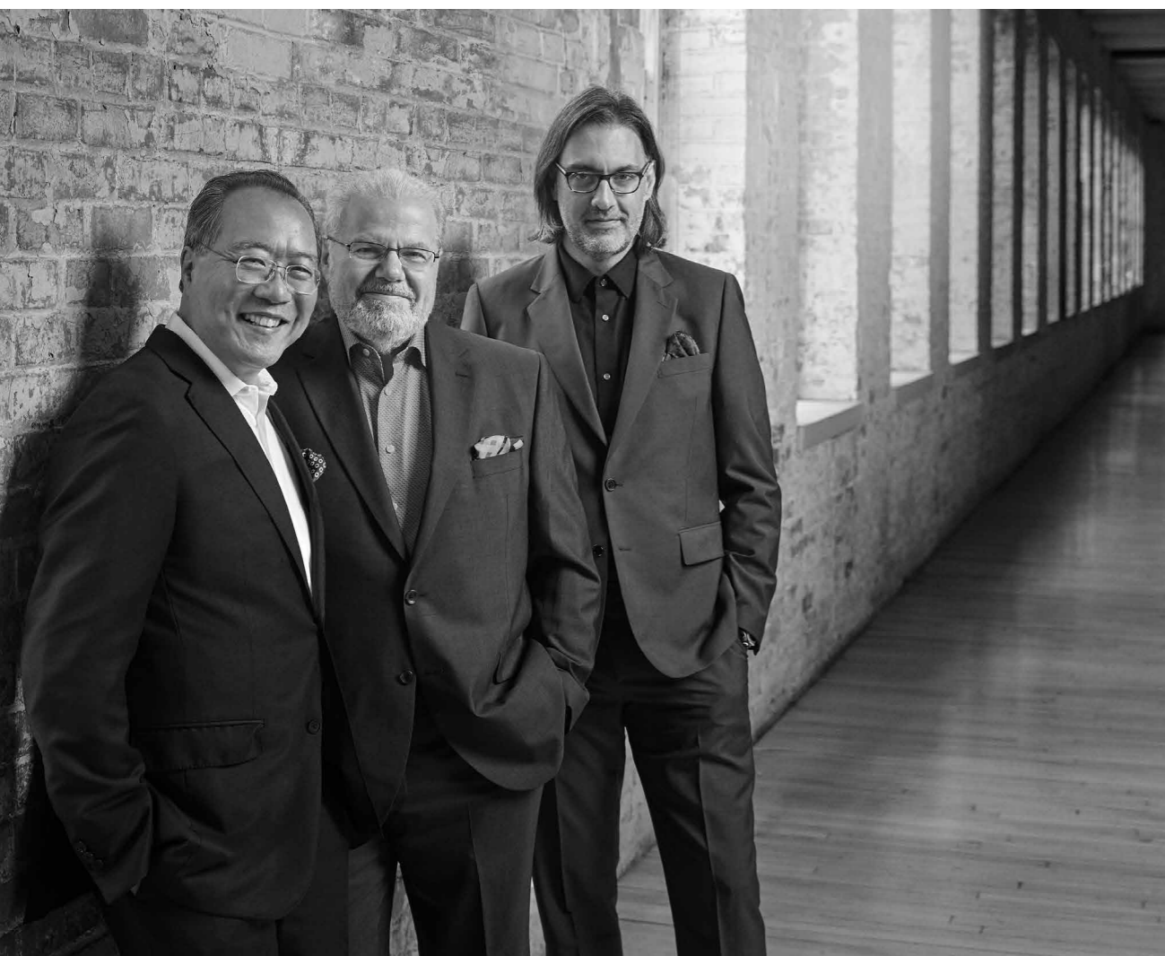
Yo-Yo Ma, Emanuel Ax, Leonidas Kavakos

Beethoven Trio avec piano n° 7 en si bémol majeur « À l'archiduc » op. 97