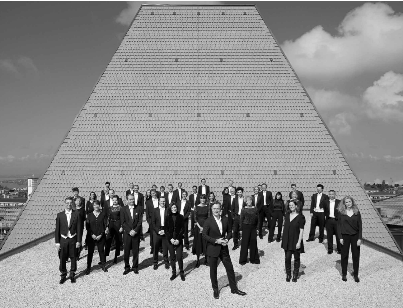
Orchestre de Chambre de Lausanne