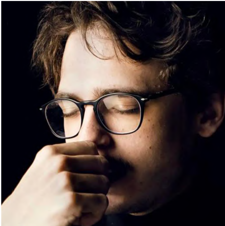
Lucas Debargue