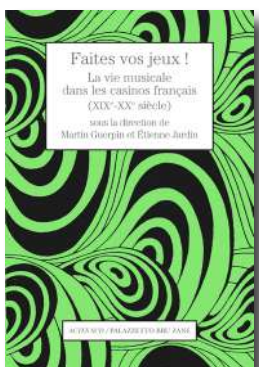
Faites vos jeux! La vie musicale dans les casinos français (XIX e -XX e siècle) sous la direction de Martin Guerpin et Étienne Jardin ACTES SUD / PALAZZETTO BRU ZANE À paraître le 24 avril 2024