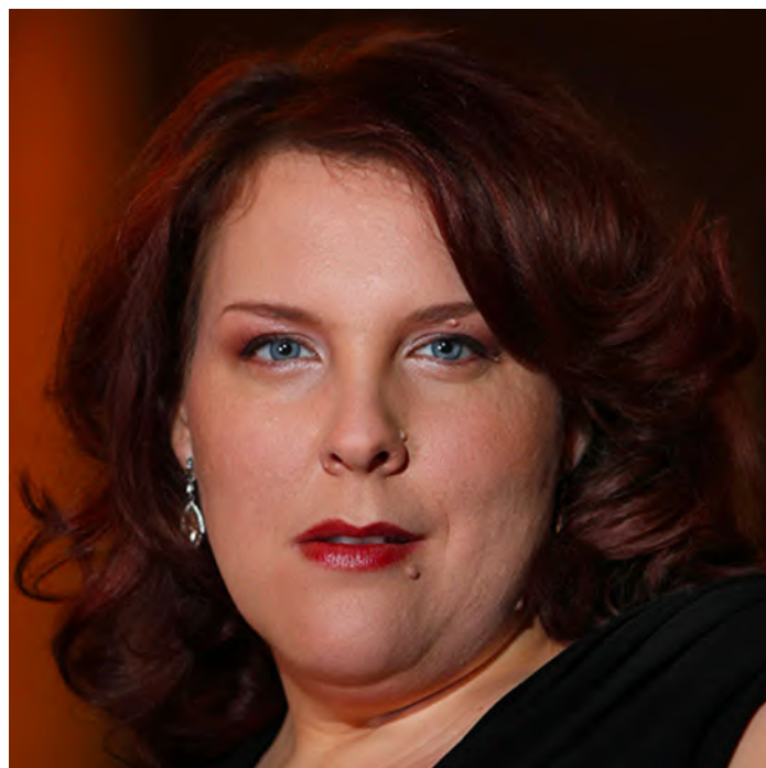
Marie-Nicole Lemieux

Éditions musicales Palazzetto Bru Zane pour les Mélodies persanes , Orientale , Danse sacrée , La Vierge , Green , Viens ! Une flûte invisible et Papillons