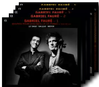
Gabriel Fauré Intégrale de la musique de chambre pour piano ALPHA CLASSICS en collaboration avec le PALAZZETTO BRU ZANE 5 CD | 2011-2014