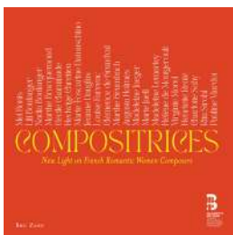
Compositrices New Light on French Romantic Women Composers BRU ZANE LABEL 8 CD | 2023