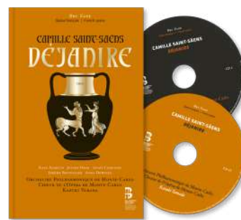
Camille Saint-Saëns Déjanire (1911) Kazuki Yamada direction ORCHESTRE PHILHARMONIQUE DE MONTE-CARLO CHŒUR DE L'OPÉRA DE MONTE-CARLO Collection « Opéra français » – Vol. 39 BRU ZANE LABEL 2024