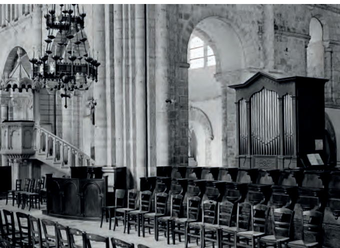
L'orgue de Lessay : l'ancien... (photo de 1934)