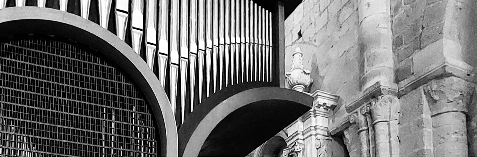
L'orgue de Lessay : le nouveau (depuis 1994)