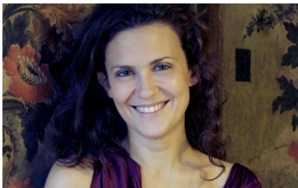
LORENZA BORRANI © LB