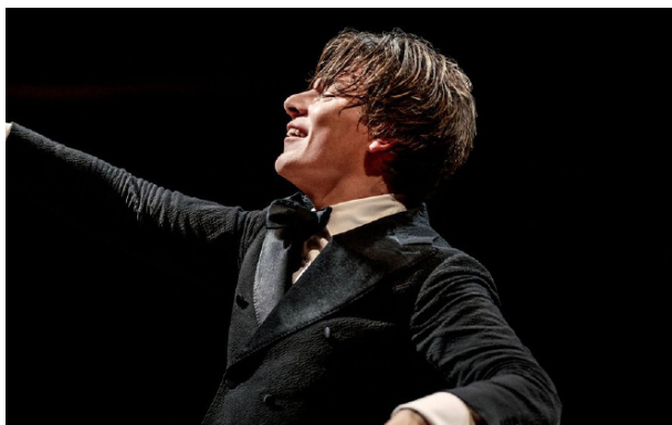
KLAUS MÄKELÄ

GRANDE SALLE PIERRE BOULEZ - PHILHARMONIE TARIFS : 10€ / 20€ / 27€ / 37€ / 42€ / 52€