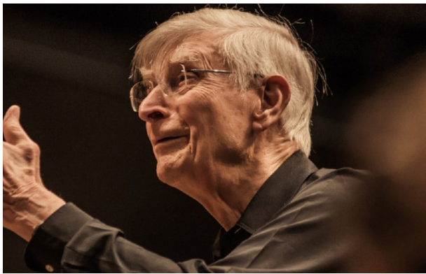
HERBERT BLOMSTEDT