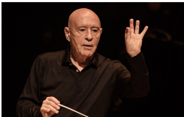
CHRISTOPH ESCHENBACH

PHILHARMONIE - GRANDE SALLE PIERRE BOULEZ