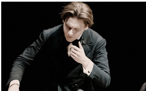
KLAUS MAKELA