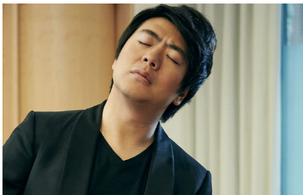
LANG LANG

Deux programmes avec le pianiste Lang Lang