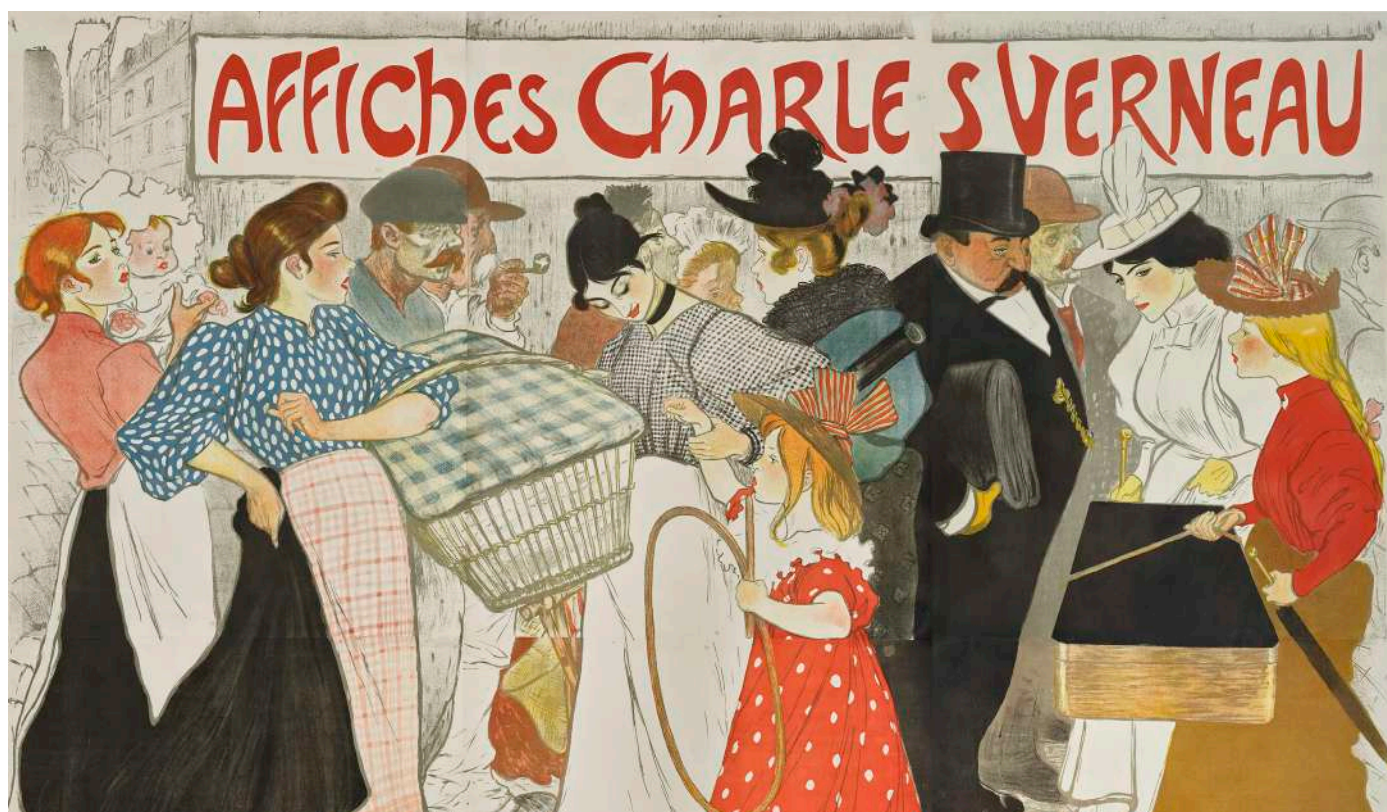
Théophile Alexandre Steinlen (1859 - 1923) Imprimerie Charles Verneau (Paris) Affiches Charles Verneau. « La Rue », 1896 Lithographie en couleurs, 240 x 300 cm Paris, Bibliothèque nationale de France, département des Estampes et de la photographie