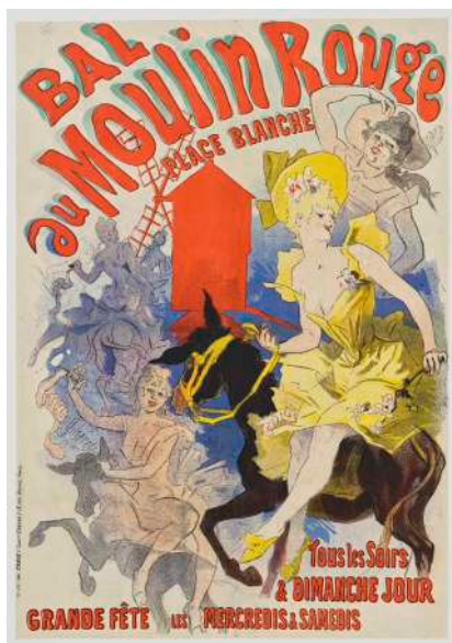
Jules Chéret (1836-1932)

Imprimerie Chaix (Paris) Bal du Moulin Rouge, 1889 Lithographie en couleurs, 122 x 86 cm Paris, Bibliothèque nationale de France, département des Estampes et de la photographie