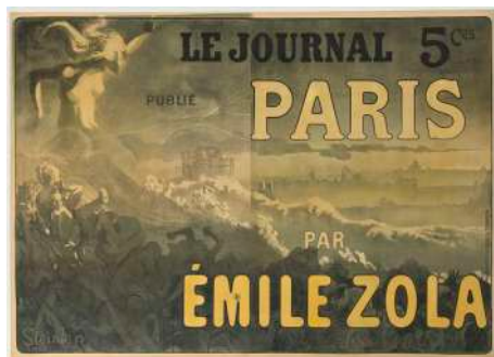
Théophile Alexandre Steinlen (1859-1923)

Imprimerie Chaix (Paris) Bal du Moulin Rouge, 1889 Lithographie en couleurs, 122 x 86 cm Paris, Bibliothèque nationale de France, département des Estampes et de la photographie