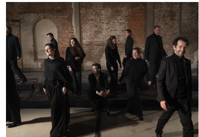
Les Métaboles

Des Prophéties de la Sybille de Roland de Lassus, sans doute le plus michel-angelesque compositeur de la Renaissance, au Prélude à l'Après-midi d'un Faune de Debussy, transcrit dans une version inédite pour chœur a cappella par Thibault Perrine, ce programme traverse plus de trois siècles d'histoire en nous montrant notamment le choc esthétique reçu par les compositeurs français du XIX e siècle en découvrant les beautés de la Renaissance italienne. Un voyage imaginé par le chef Léo Warynski et son ensemble Les Métaboles, révélation de ces dernières années dans le domaine de la musique chorale.