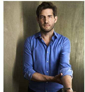
Léo Warynski