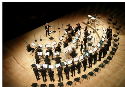
Ensemble Correspondances

Au moment même où Annibale Carrache peint les fresques de la galerie Farnèse, la ville de Rome connaît, comme toute la péninsule italienne, une véritable révolution musicale. Les polyphonies de la Renaissance laissent progressivement la place à la musique baroque, et de nouveaux genres vocaux comme l'opéra, la cantate ou l'oratorio prennent leur essor. Grands spécialistes de cette période, Sébastien Daucé et son ensemble Correspondances nous proposent de nous replonger dans l'effervescence de la ville éternelle avec une soirée musicale inédite, telle qu'elle aurait pu se dérouler dans un palais princier ou épiscopal à Rome au début du seicento .