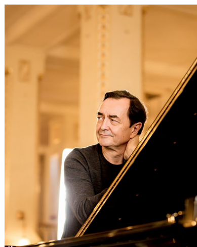
Pierre-Laurent Aimard