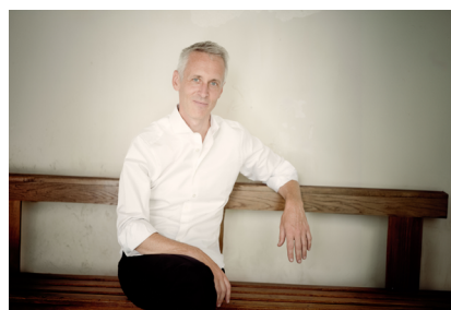
Sébastien Daucé