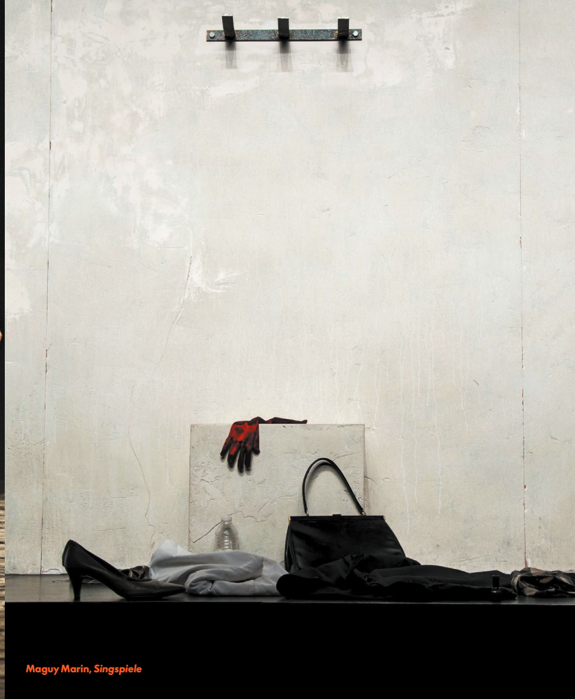
Maguy Marin, Singspiele