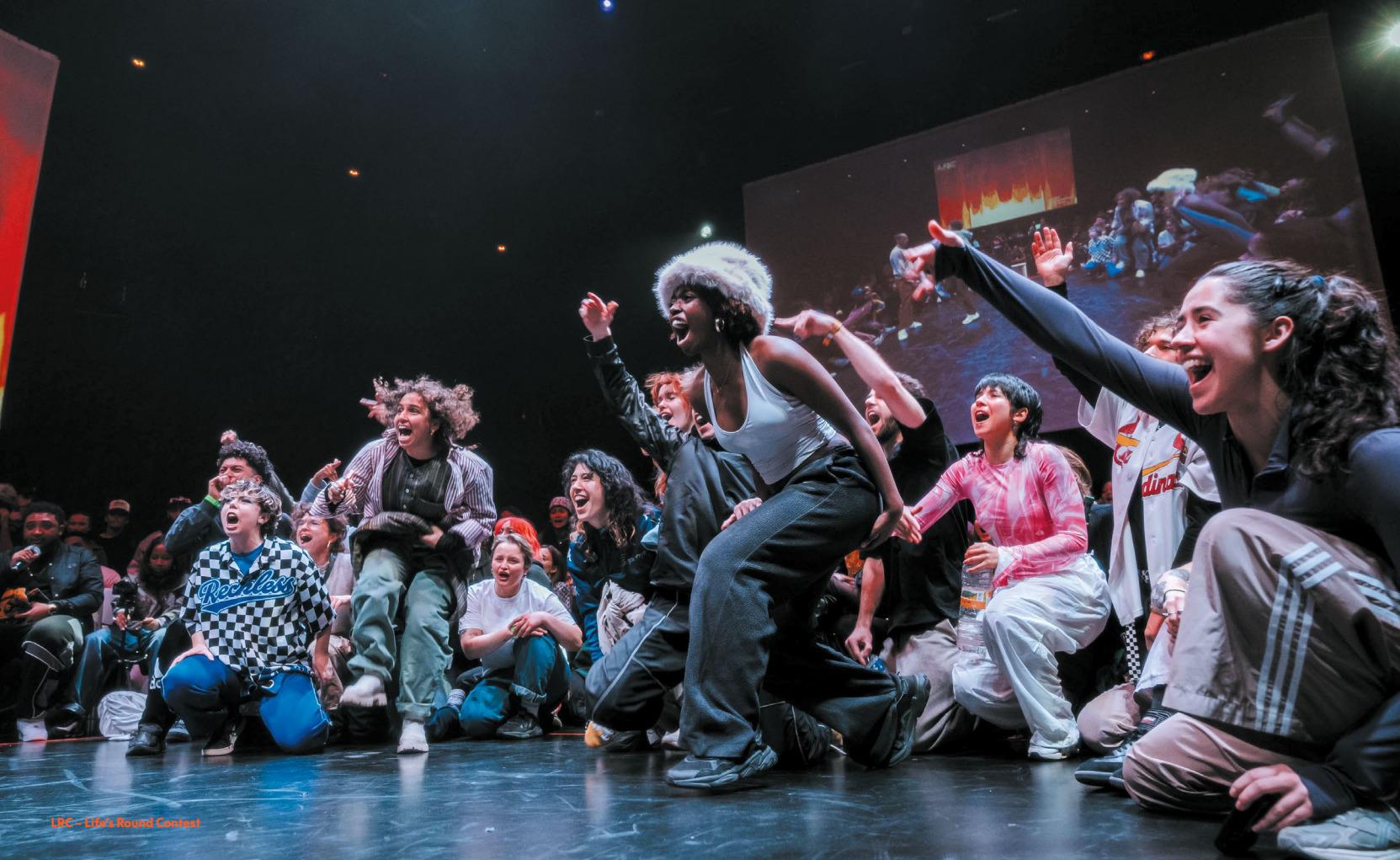
LRC - Life's Round Contest