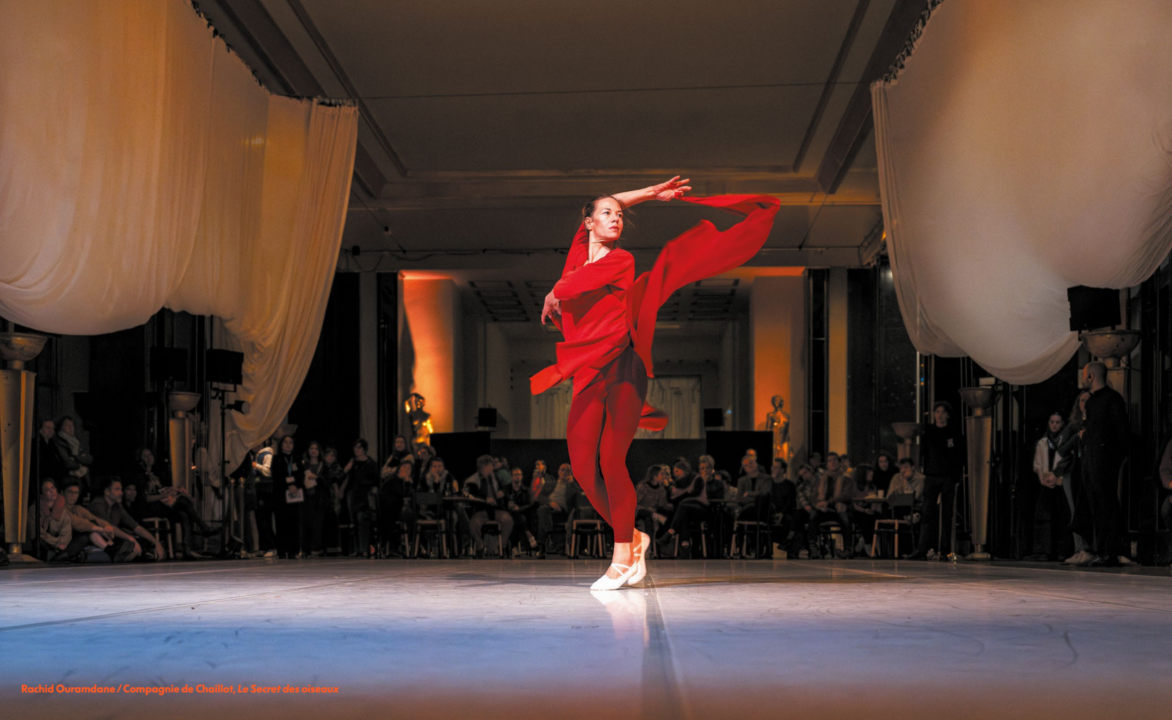
Rachid Ouramdane / Compagnie de Chaillot, Le Secret des oiseaux