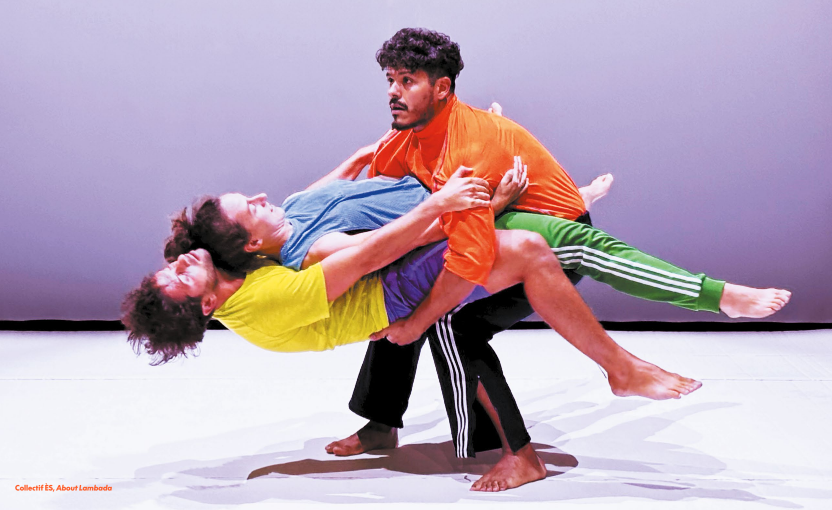
Collectif ÈS, About Lambada