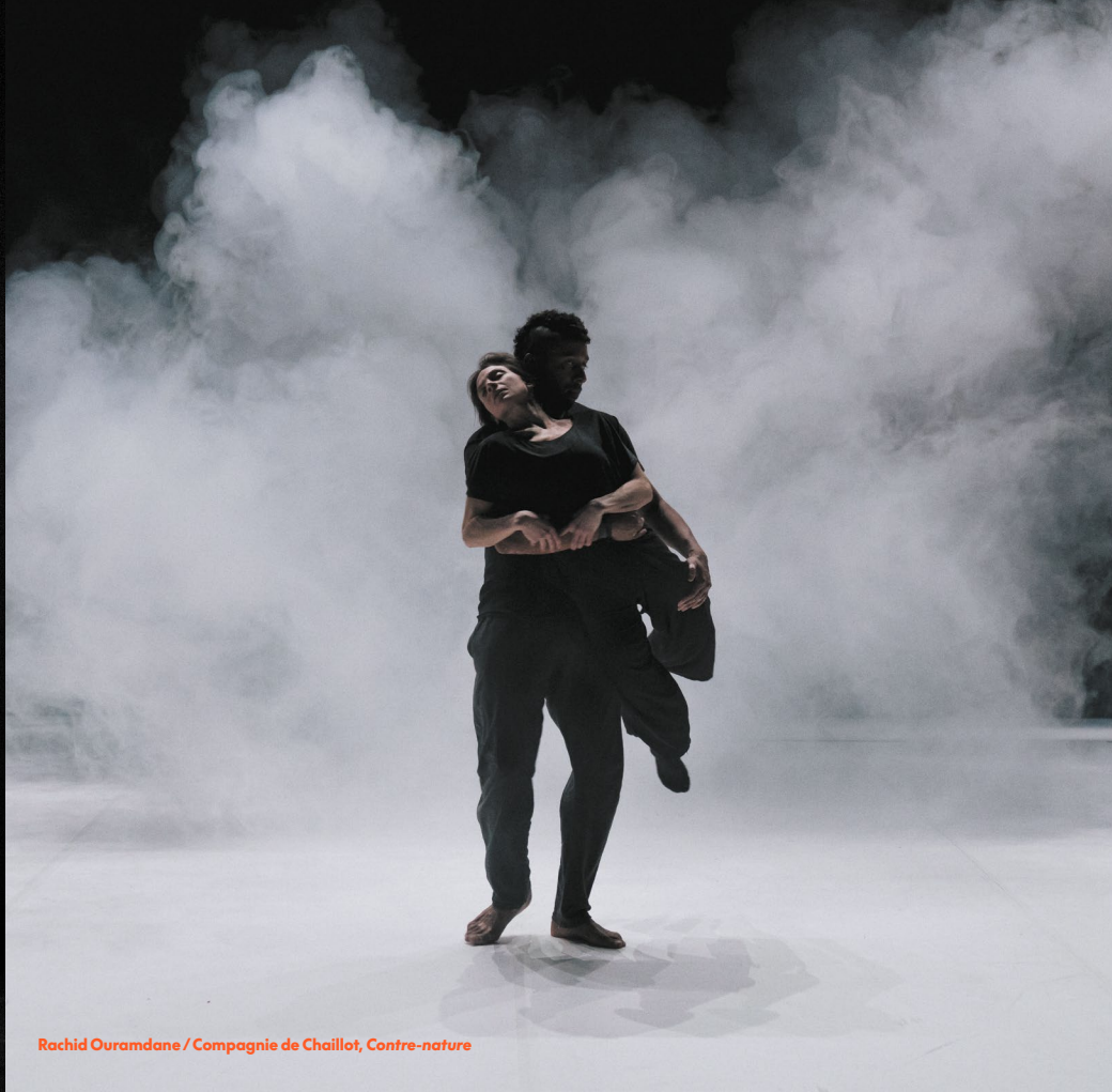
Rachid Ouramdane / Compagnie de Chaillot, Contre-nature