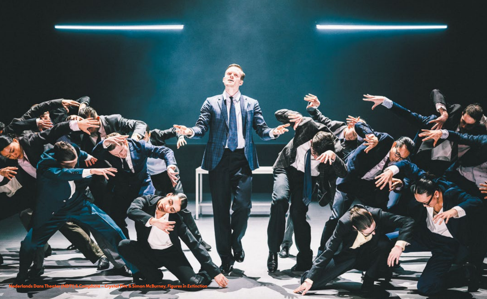
Nederlands Dans Theater (NDT) & Complicité – Crystal Pite & Simon McBurney, Figures in Extinction