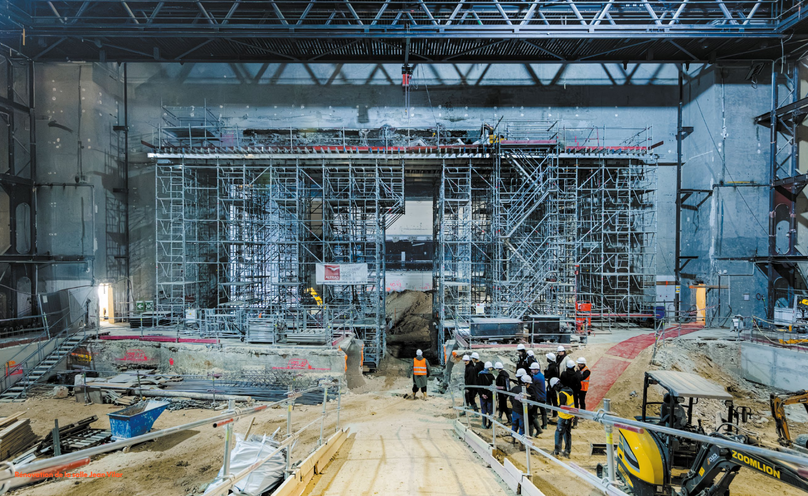
Rénovation de la salle Jean Vilar