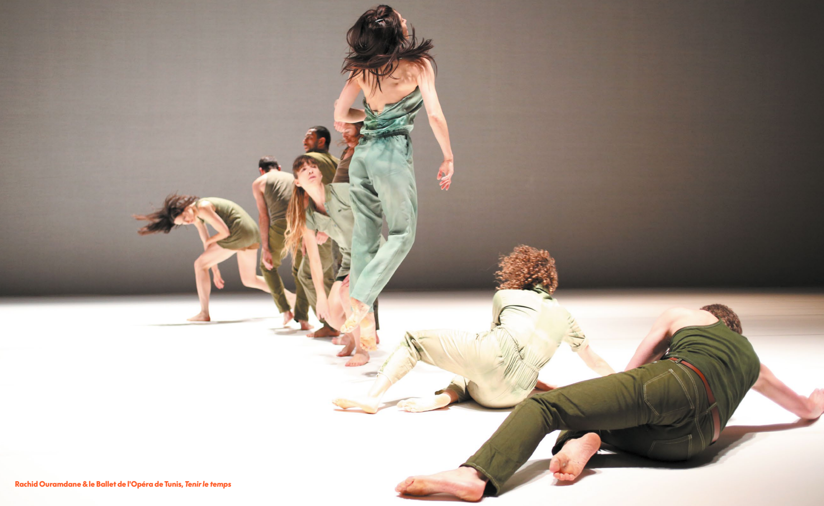
Rachid Ouramdane & le Ballet de l'Opéra de Tunis, Tenir le temps