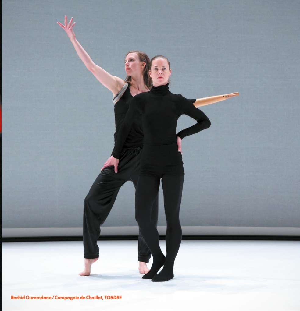
Rachid Ouramdane / Compagnie de Chaillot, TORDRE