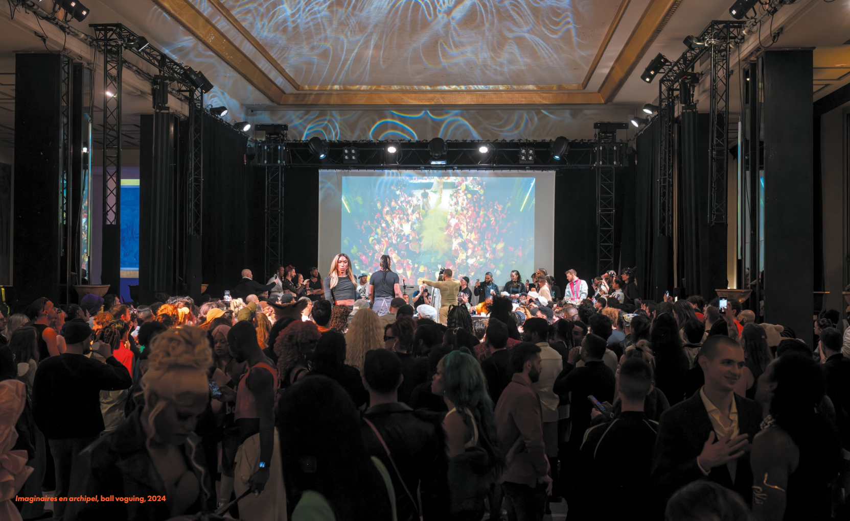
Imaginaires en archipel, ball voguing, 2024