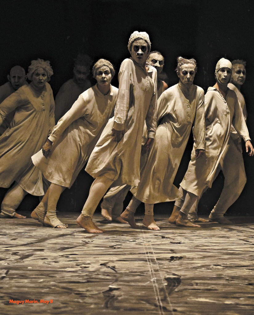
Maguy Marin, May B