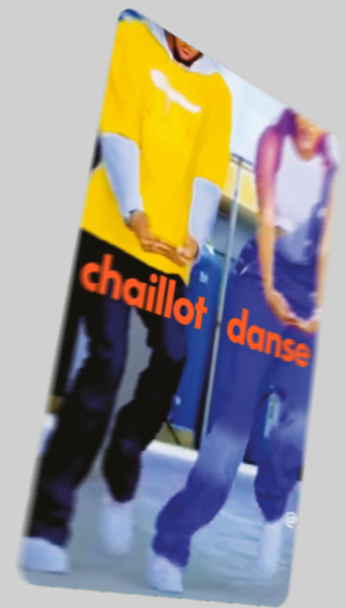
Pass Chaillot Groupe