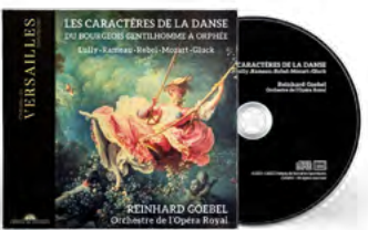
Orchestre de l'Opéra Royal Reinhard Goebel Direction