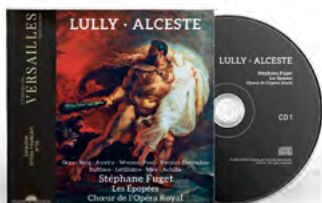
Les Épopées Chœur de l'Opéra Royal Stéphane Fuget Direction