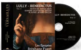
Les Épopées Stéphane Fuget Direction