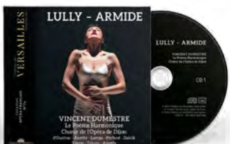
Chœur de l'Opéra de Dijon Le Poème Harmonique Vincent Dumestre Direction