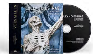
Les Épopées Stéphane Fuget