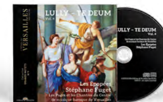
Les Pages et les Chantres du CMBV Les Épopées Stéphane Fuget Direction