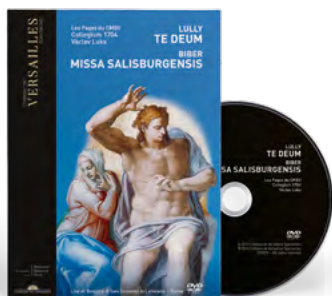
Les Pages du CMBV Collegium 1704 Collegium Vocale 1704 Václav Luks Direction