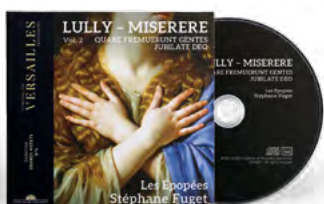
Les Épopées Stéphane Fuget