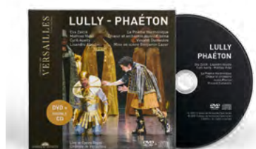
Le Poème Harmonique Chœur et orchestre musicAeterna Vincent Dumestre Direction Benjamin Lazar Mise en scène