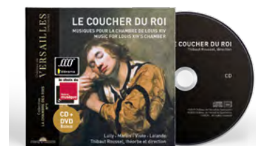
Sébastien Daucé Thibaut Roussel Théorbe et direction