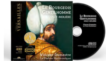
Le Poème Harmonique Vincent Dumestre Direction