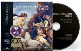
Ensemble Aedes Le Poème Harmonique Vincent Dumestre Direction