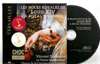
Chœur de la Compagnie de la Tempête Le Poème Harmonique Vincent Dumestre Direction