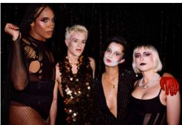
Cabaret La Bouche