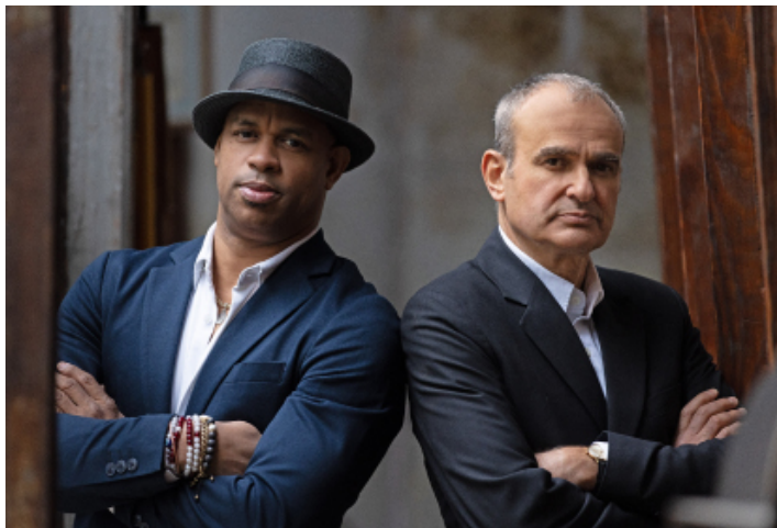
Roberto Fonseca & Vincent Ségal