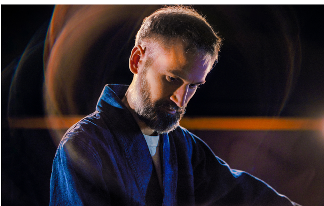
Roberto Negro

Avec : Roberto Negro, compositions, piano, voix.