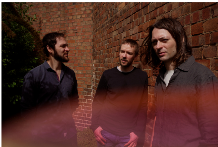
Mammal Hands © Tania Blanco