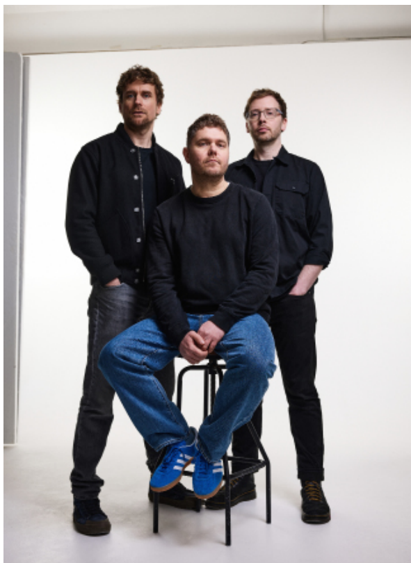
GoGo Penguin

Fidèle à Jazz à la Villette, GoGo Penguin déploie sur scène les merveilles d'un nouvel album somptueux. Le trio anglais y trouve un nouvel équilibre entre électronique et acoustique, textures sonores neuves et mélodies solaires.