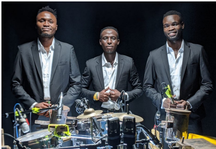
Arsenal Mikebe

Polyrythmies entêtantes, courses effrénées de percussions acoustiques et électroniques, voix hululées et drones synthétiques, la musique du trio Arsenal Mikebe saisit immédiatement par sa puissance de frappe peu commune. Basé à Kampala, les percussionnistes ougandais ont publié en 2024 un premier album stupéfiant, le bien nommé DRUM MACHINE, joué sur un dispositif conçu sur-mesure par le sculpteur Henry Segamwenge, une « machine à percussion » en acier moulé, qui intègre différents instruments et ustensiles pour créer un son inspiré de la mythique boîte à rythmes TR-808. Sur scène, les trois musiciens se font face, répartis aux trois angles de cet imposant triangle, pour emmener loin leur transe sauvage. Et le public avec eux.