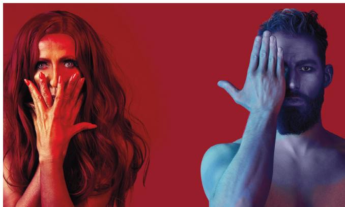
Marjolaine Reymond

Marjolaine Reymond, chanteuse, compositrice, signe toute la musique et les textes pour ce sixième projet Or vagabond. Huit poèmes de troubadours proches du surréalisme pour un conte d'amour, la rencontre avec un vagabond. Une musique impressionniste pour quatuor à cordes proche de Fauré, Poulenc, Satie, Debussy, Dutilleux, Stravinsky qui se mélange aux métriques pulsées des musiques actuelles.