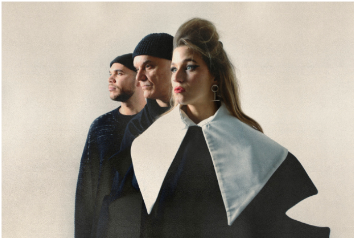
Selah Sue & The Gallands