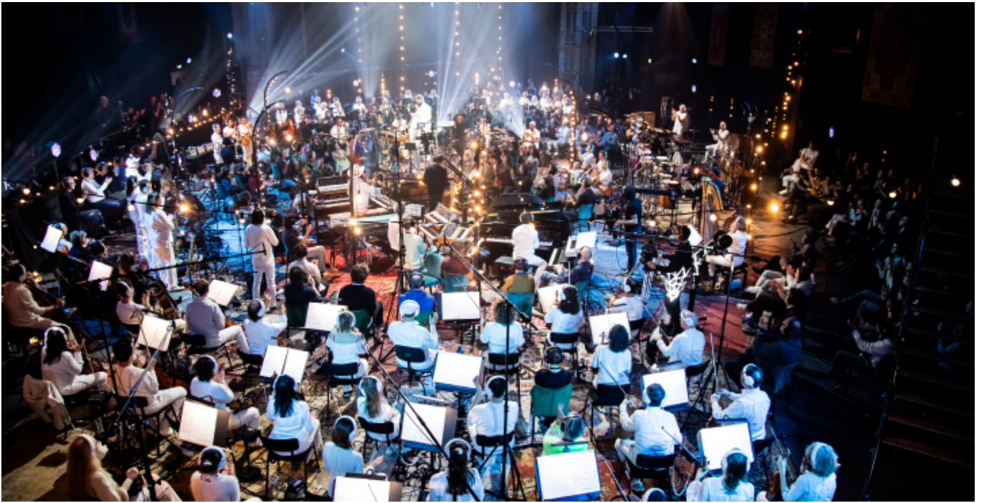
Snarky Puppy & Metropole Orkest

Beaucoup de (beau) monde sur scène pour l'ouverture de Jazz à la Villette 2026 avec la collaboration événement entre le collectif new-yorkais Snarky Puppy et le Metropole Orkest.