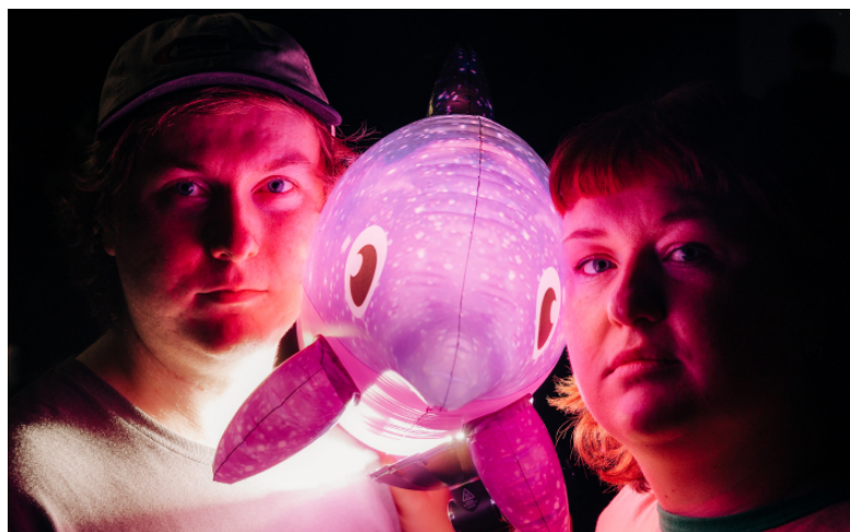
Dolphin Hyperspace