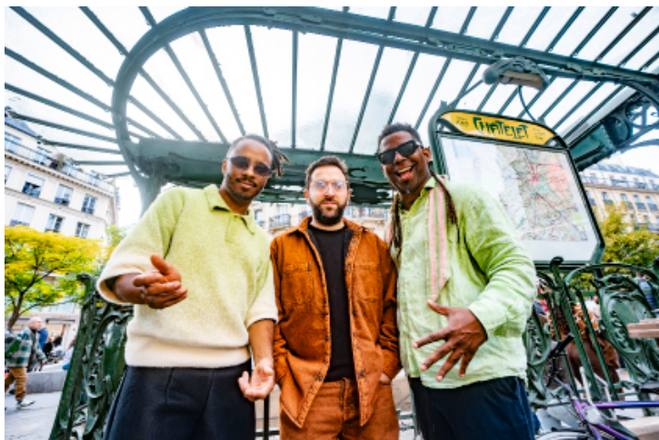
The Getdown