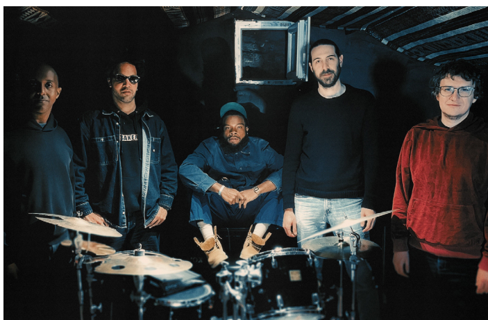
Nova Fellowship