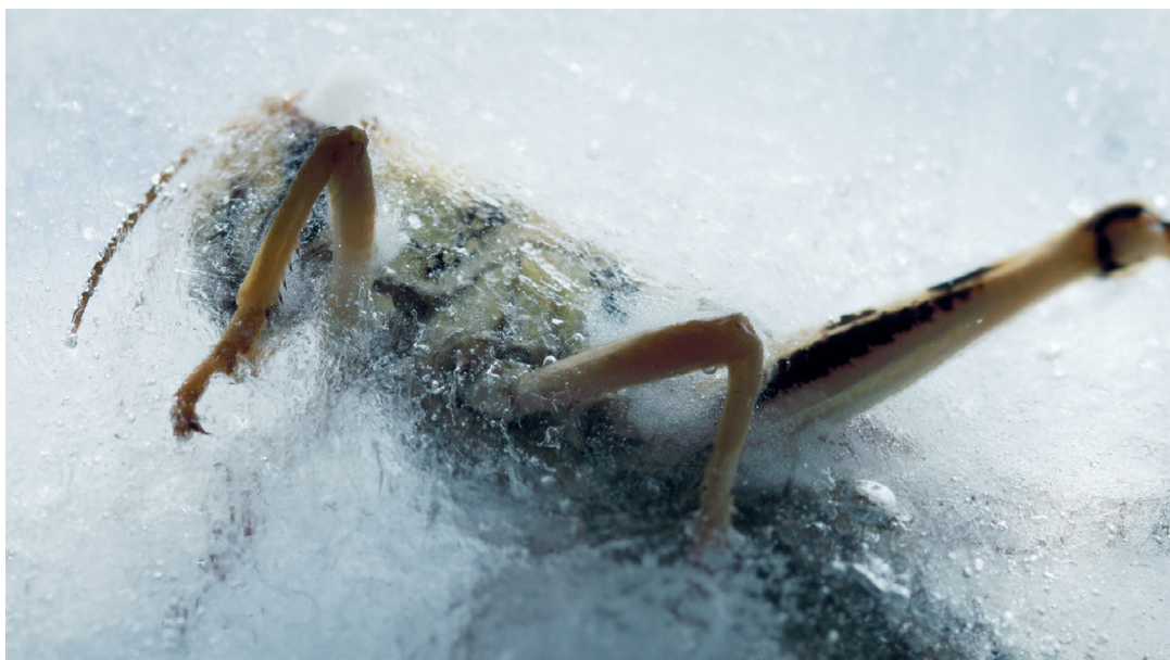
Momoko Seto, Planet Sigma

Momoko Seto est une réalisatrice japonaise née en 1980 à Tokyo. Elle s'installe en France et étudie aux beaux-arts de Marseille puis elle rentre au Fresnoy en 2006. Elle entre ensuite au CNRS comme ingénieur de recherches réalisatrice