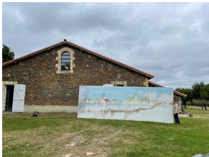
Fabryce Hyber, xxxxxx xxxxxx

France, 2027, Jardin à la française thématique Fruit d'une commande du Centre Pompidou à Fabrice Hyber, le "Jardin Binus" est un jardin à la française qui mêle essences d'arbres et de plantes dans un labyrinthe composé de chemins, de haies et de barrières dont le plan correspond à l'arborescence des différentes actions de "jeter à la poubelle" de l'Internet. L'œuvre sera produite en 2027 mais Fabrice Hyber présentera au public du festival un dessin grandeur nature d'une superficie de 1,6 ha (soit la superficie du bâtiment principal du Centre Pompidou) réalisé à la tondeuse sur les lieux-mêmes du futur jardin sur le domaine de la Serrie.