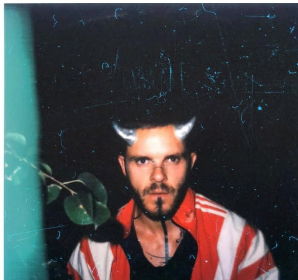
Claudius Pan

La Médiathèque intercommunale de Mareuil-sur-Lay-Dissais nous ouvre ses portes dans le cadre du festival pour accueillir des rencontres littéraires. Dans un premier temps avec l'artiste Claudius Pan, en amont de sa performance, autour de son livre Les Grands Vivants , puis avec André Dimanche, grande figure du monde de l'édition et photographe. Ces échanges sont une occasion de découvrir ou redécouvrir leurs travaux et leurs réflexions.