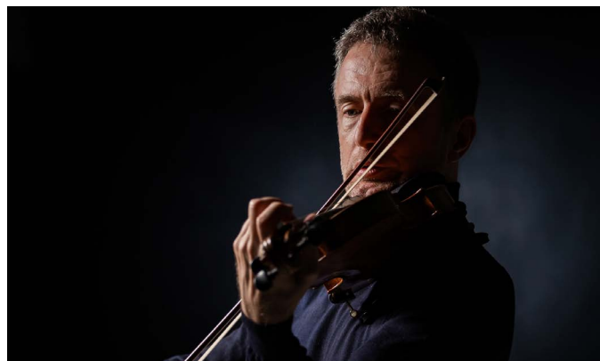
Figure mythique de son temps, Paganini marqua profondément ses contemporains, au premier rang desquels Hector Berlioz. Admiratif de son génie, ce dernier reçut de lui un soutien décisif : après avoir entendu la Symphonie fantastique , Paganini lui offrit une importante somme d'argent qui permit à Berlioz de poursuivre son

œuvre. Quelques années plus tôt, il lui avait également commandé une pièce pour alto, à l'origine de Harold en Italie .